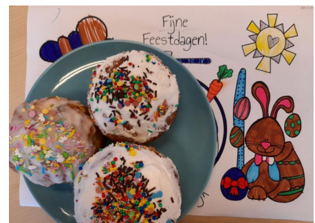
Zie foto; Een traditioneel Paasbrood uit Oekraïne

Een mooie Paasgedachte die we ook graag met u als ouder willen delen.