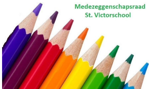
Medezeggenschapsraad St. Victorschool