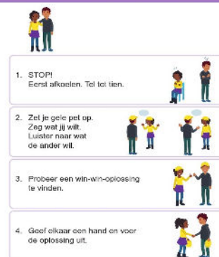
Stappenplan Praat het uit

"Hoe kun je iets 'vertellen' zonder je stem te gebruiken, bijvoorbeeld met je gezicht, armen, handen? Laat zien dat je iets leuk vindt en niet leuk vindt."