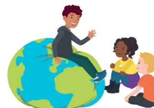
We hebben oor voor elkaar

Voor de kerstvakantie ronden we blok 3 af. Het thema van dit blok is: We hebben oor voor elkaar. Met alle kinderen van de school hebben we aan dit thema gewerkt, erover geleerd en situaties uitgespeeld.